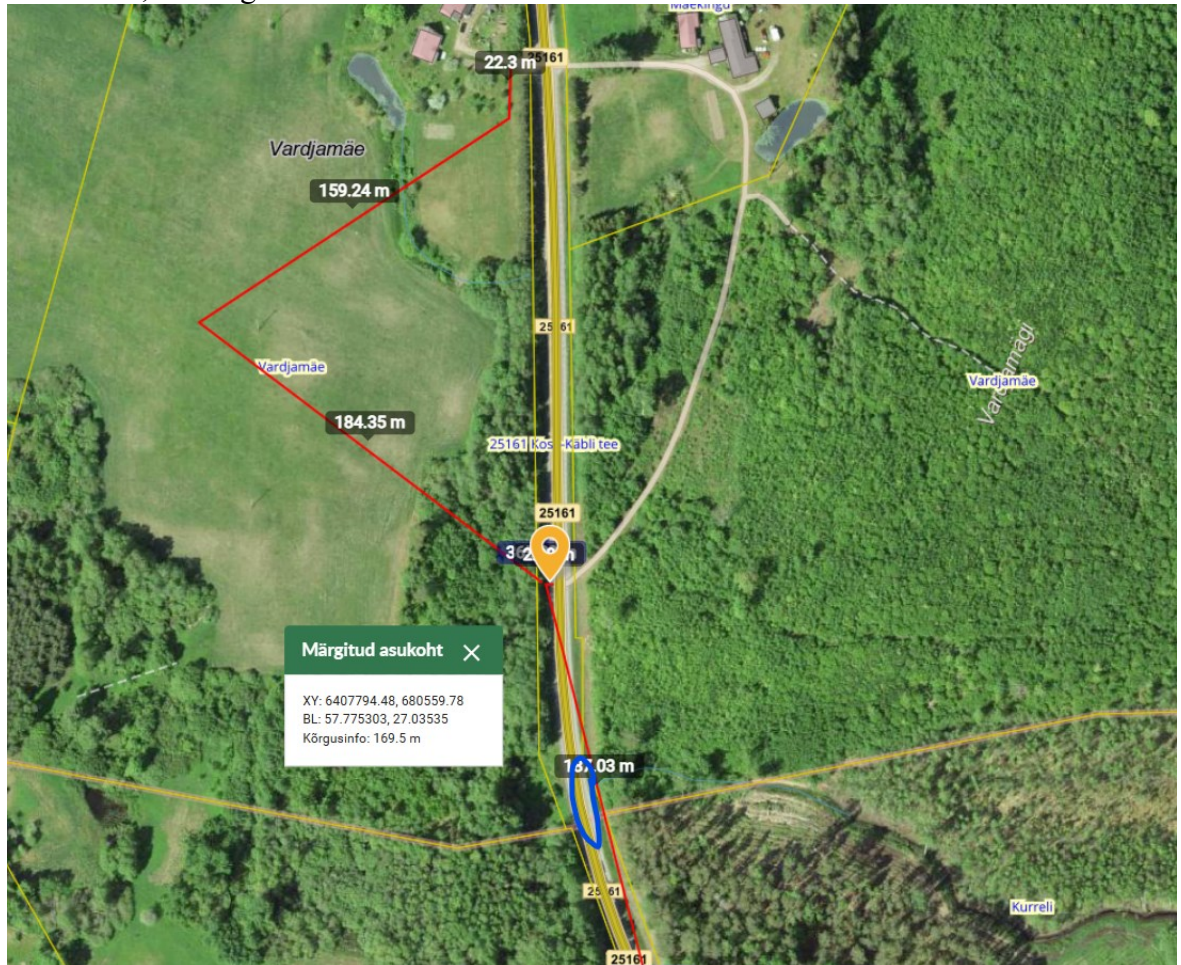
Joonis 1. Ristumiskoha asukoht tähistatud oranži tingmärgiga. Nähtavuse parandamise vajadus tähistatud sinise ovaaliga.